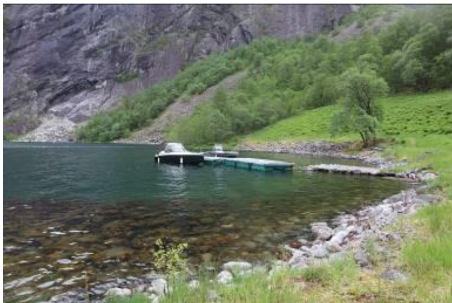
Bildet viser strandsona søraust for kaien i Finnabotnen.

Kaien er planlagt rehabilitert slik at den vil få om lag same mål som eksisterande kai. Det vil vera mindre mengder stein det er bruk for til reparasjon av fundamentet. Stein som vert plukka skal ikkje føra til store endringar i landskapet, og skal plukkast enkelt vis i vasskanten søraust for kaien. Det må ikkje plukkast stein frå den gamle båtstøa i stranda aust for kaien. Forvaltar vurderer arbeidsmetoden med bruk av båt til rehabiliteringa som ein god og miljøforsvarleg metode for dette tiltaket jf. nml. § 12. Med denne metoden er det ikkje naudsynt med større maskiner på land, og steinar kan plukkast frå vasskanten frå båten.