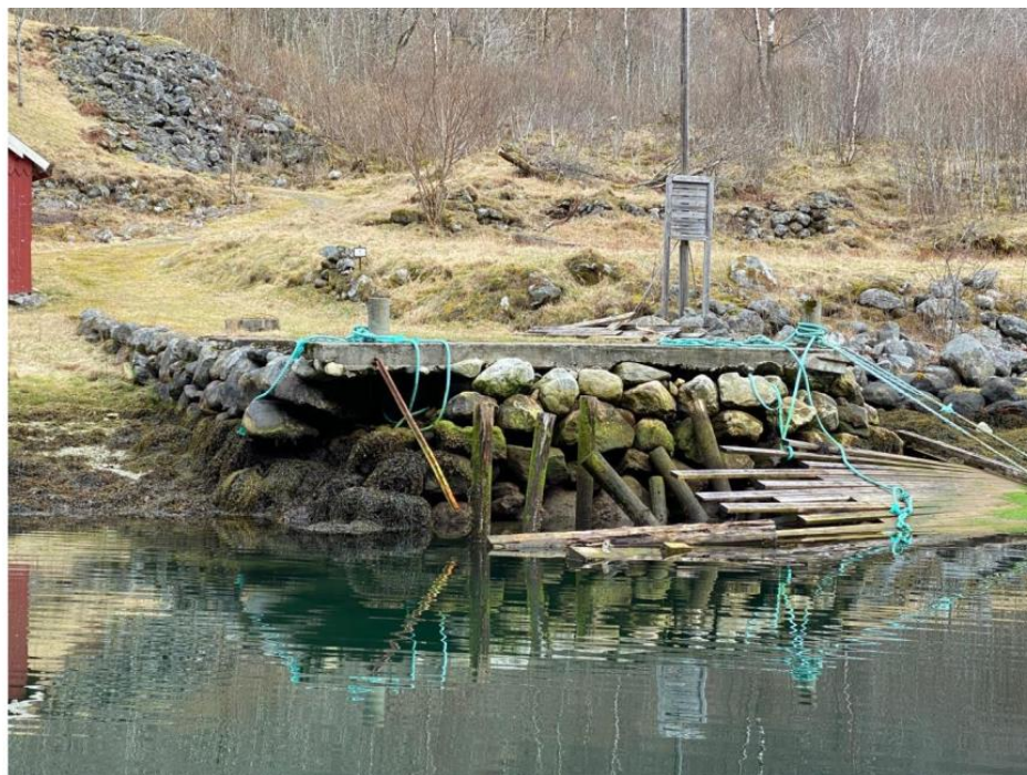
Båtkaia i Finnabotnen. Kopi frå søknad