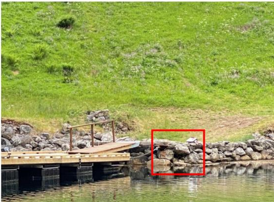
Bilde av flytekai med skade. Kopi frå søknad

Flytekaien har ein mindre skade på det eine hjørna på eksisterande fundament. Dei vil bruka stein frå vasskanten for å reparera skaden på fundamentet.