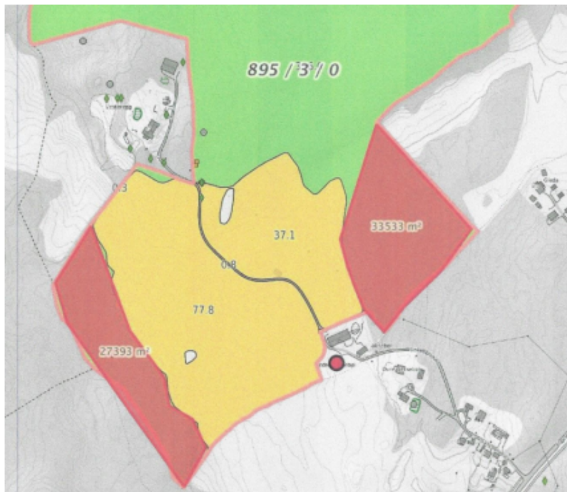
Figur 2: Utsnitt fra Gårdskart gnr./bnr. 895/3. To av plantefeltene er markert i rødt.