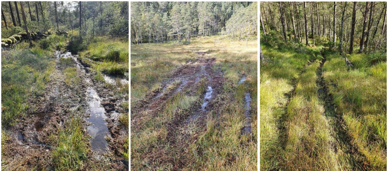
Bilder av kjørespor fra ATV inne i Yddal naturreservat.

vegetasjonen og terrenget er skadet og ødelagt etter kjøring med ATV. Se bilder av terrengskadene etter kjøring med ATV i naturreservatet.