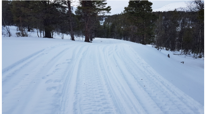
Foto: kjørespor på veg i Vermedalen

Når det gjeld snøscooter som tvilsom transportmåte så er det ingen tungtvegande argument for at det ikkje er egna framkomstmiddel. Det er heller ingen dokumentasjon frå lege om at ein ikkje kan gjennomføre persontransporten på snøscooter til hytta i dette tilfelle. I Nasjonal forskrift om motorferdsel i utmark og på islagte vassdrag § 5 pkt. b) , er snøscooter for funksjonshemma spesifisert som forsvarleg framkonstmiddel på snødekt mark.