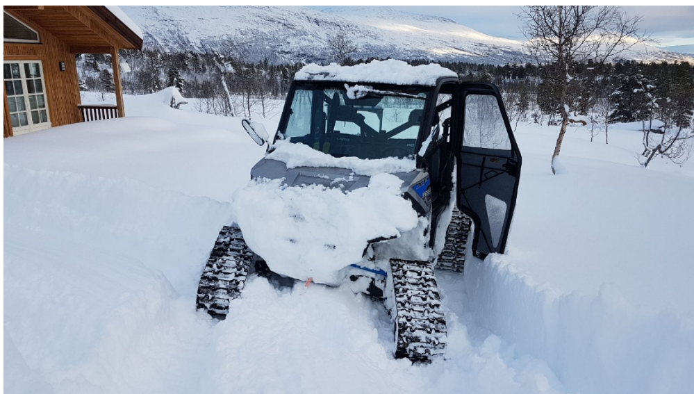
Foto: UTV Polaris Ranger XP med belter, reg.nr: BJ2464