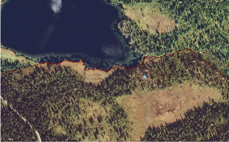
Kart 1) Brun skravering = utsnitt av Budeiberget NR; Blå prikk = passering av krakker.