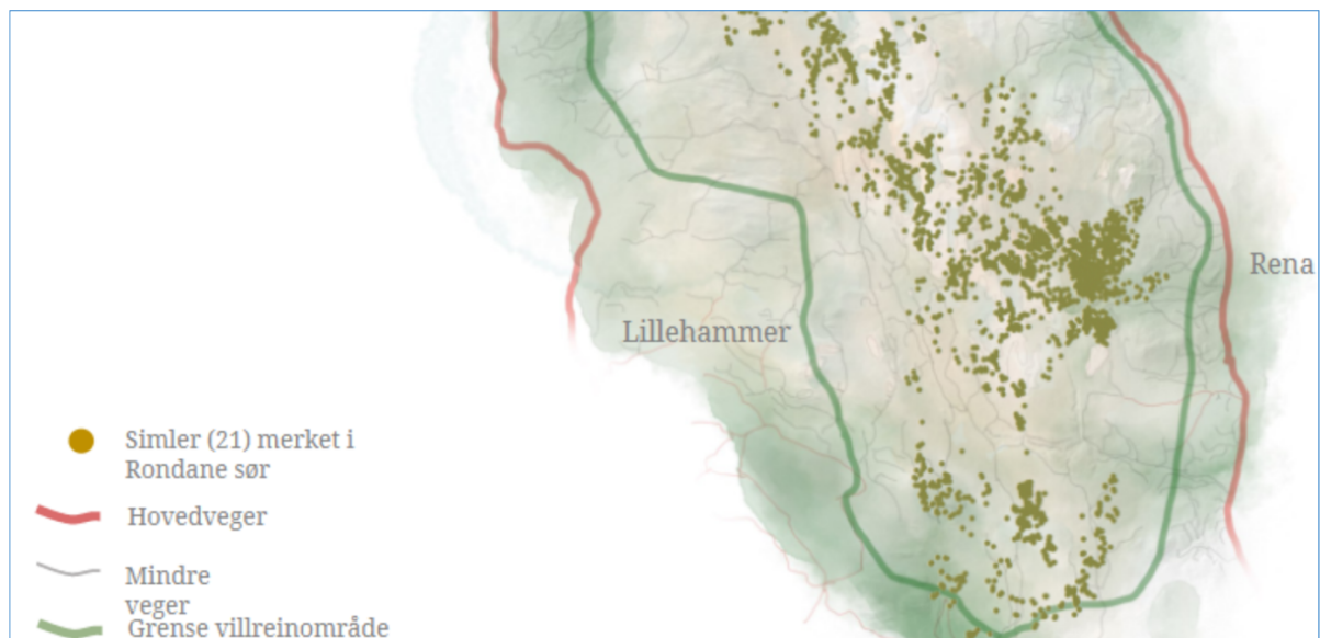
Figur 2. Plott fra GPS-merka simler Rondane sør – om høsten.

Plott fra GPS-merka simler sin bruka av området om høsten er vist i figur 2.