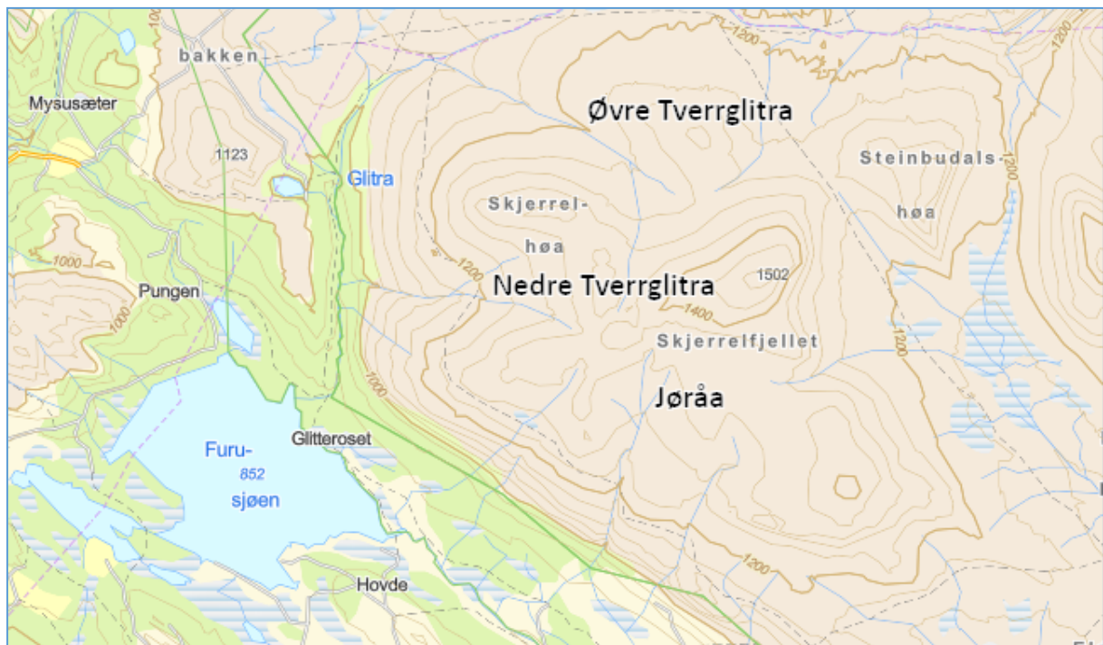
Figur 1. Kartutsnitt for Jøråa, Nedre Tverrglitra og Øvre Tverrglitra.

I figur 1 er det vist et kartutsnitt for Jøråa, Nedre Tverrglitra og Øvre Tverrglitra.