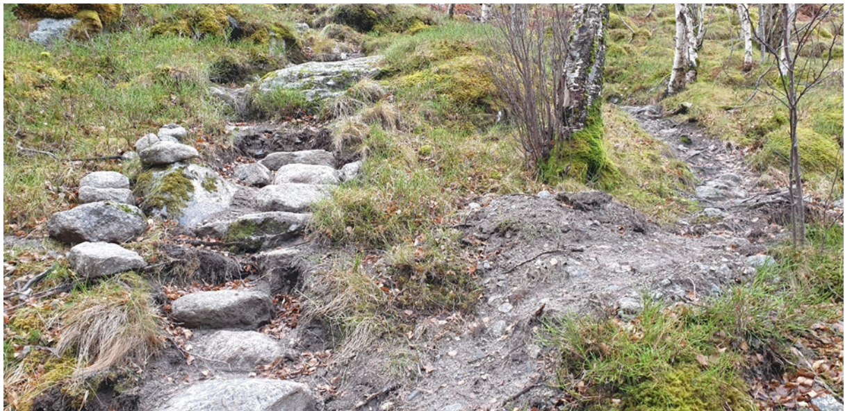
Figur 1 Viser punkt 1. Her skal stifaret til venstre utbetrast med stein for å samle trafikken

Punkt 1 er i NINA sin sårbarheitsvurdering (2018) nemnt som sårbart for erosjon (sjå figur 1).