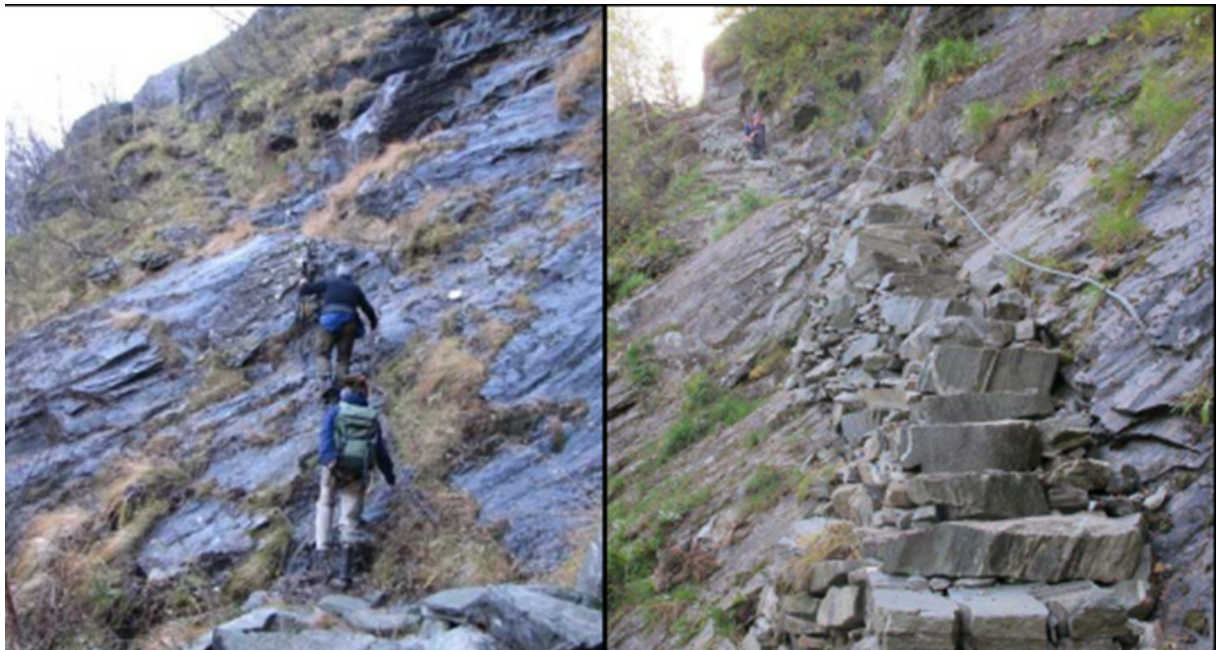
Figur 2 Viser punkt 3, trappa rett over Stighilljaren, før og etter restaurering (2014). I dag er den skada av stein og is og treng vedlikehald.