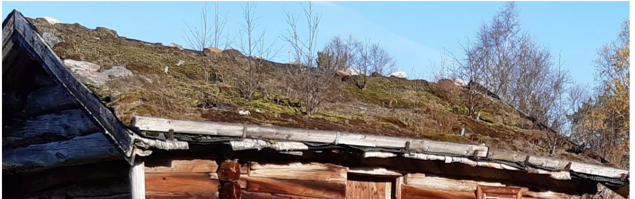
Torvtaket på sørsida av høyløa, rapport Alvstusetra 2020 , Nordmøre museum, Husasnotra