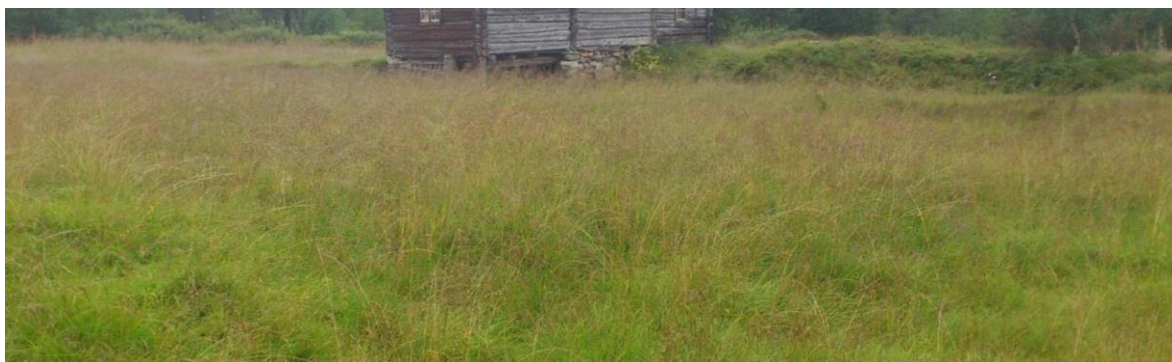
Naturbeitemarka sett mot sørøst, jf. skjøtselsplanen

I henhold til vegetasjonskartleggingen fra skjøtselsplanarbeidet har stølen relativt lite artsmangfold. Skjøtselen har mål om å få restaurert området fra naturbeitemark til den opprinnelige naturtypen slåttemark med et vesentlig større artsmangfold. Slike naturbeitemarker under gjengroing fra tidligere slåttemark har vanligvis frøbanker av arter fra tida som slåttemark. I grasdekte områder er det flere faktorer som gjør at disse frøene ikke spirer og/eller makter å trenge gjennom vegetasjonslaget grasdekte områder gir. Uttak av noe torv vil kunne ha positivt bidrag på artsmangfoldet iht. målet med skjøtselsplanen da det vil eksponere frøbanken for spirefremmende faktorer og fjerne de spirehemmende stoffer fra enkelte gressarter.