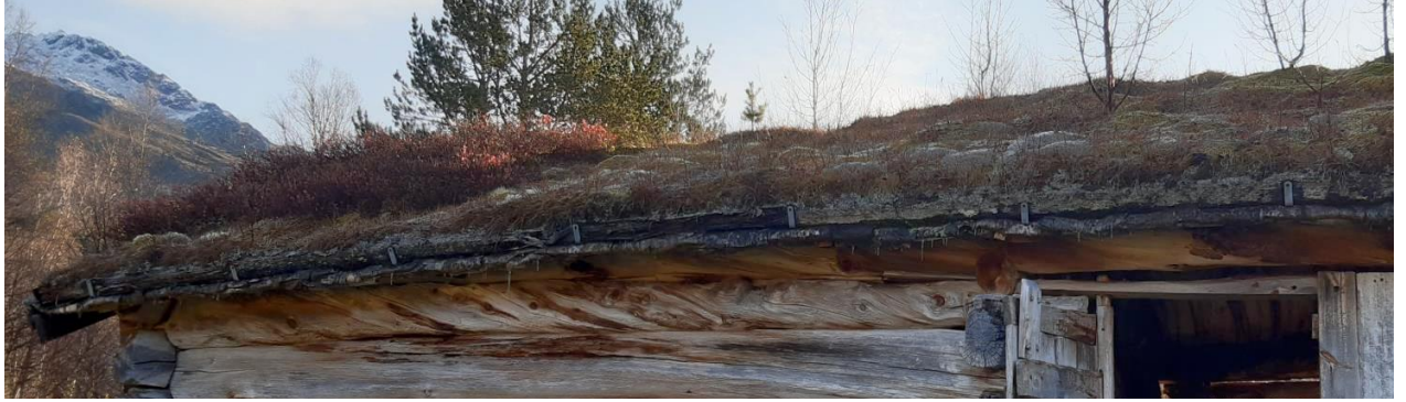
Torvtaket på nordsida av fjølset, rapport Alvstusetra 2020 , Nordmøre museum, Husasnotra