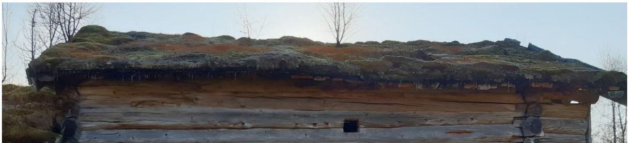
Torvtaket på nordsida av høyløa, rapport Alvstusetra 2020 , Nordmøre museum, Husasnotra