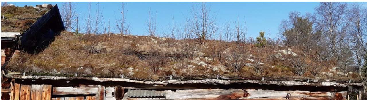
Torvtaket på sørsida av fjølset, rapport Alvstusetra 2020 , Nordmøre museum, Husasnotra