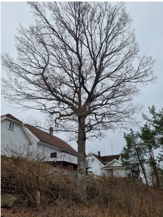
Fig. 2: Den aktuelle eika. Foto tatt under kommunens befaring 13.04.2022.

Kommunen er pliktig til å registrere dette vedtaket knyttet til utvalgt naturtype hul eik i Miljøvedtaksregisteret, hvor vedtaket kan påklages av personer og organisasjoner med rettslig klageinteresse.